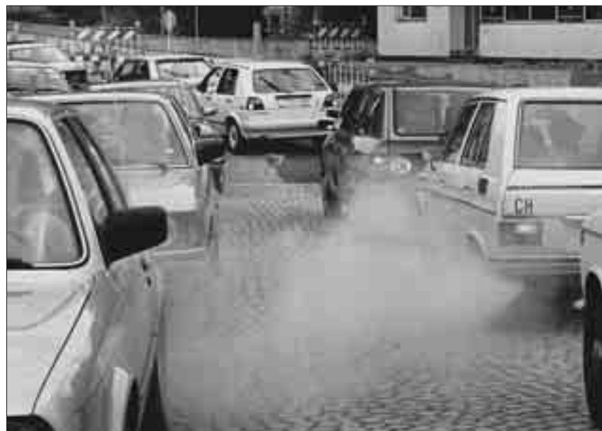
Die drei Initianten der Verfassungsinitiative zum Verkehr wollen, dass die Transitstrassenkapazität nicht erhöht werden darf.

Ich möchte mich noch gegen etwas konkret aussprechen: Sie versuchen uns drei Initianten auseinander zu dividieren. Wir haben ganz bewusst, und dies