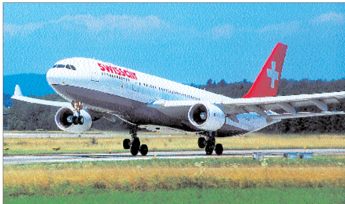
Erstmals in der Geschichte der Schweizerischen Luftverkehrsgesellschaft trägt ein modernes Langstreckenflugzeug das Wappen eines Nachbarstaates. Auf Initiative des Schweizer Vereins in Liechtenstein hat die Swissair einen neuen Airbus 330-222 auf den Namen «Fürstentum Liechtenstein» immatrikuliert. Seite 7

Ein Airbus der Swissair trägt den Namen «Fürstentum Liechtenstein»